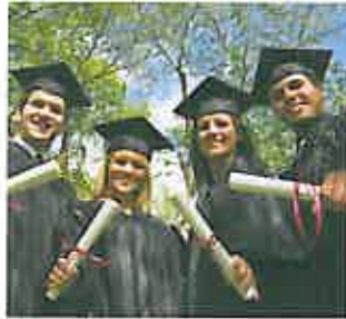
Tại lễ tốt nghiệp trung học