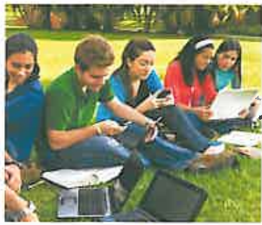
Giữ liên lạc với bạn bè