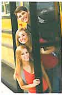
Trên xe bus về nhà